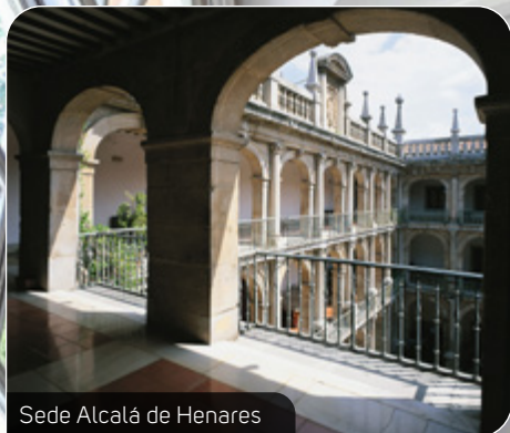
Sede Alcalá de Henares